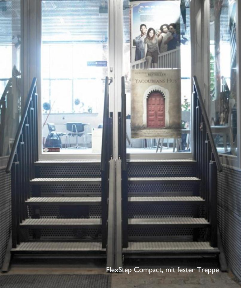
FlexStep Compact, mit fester Treppe