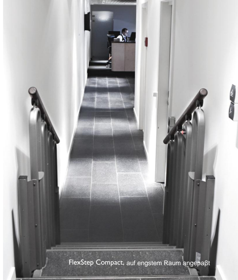
FlexStep Compact, auf engstem Raum angepaßt